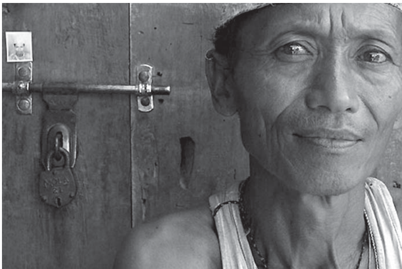
Bertatap muka dengan korban: kegiatan ICRC untuk Orang Hilang di Nepal ...

Pihak berwenang di Timor-Leste maupun di Indonesia perlu melakukan upaya semaksimal mungkin untuk menjunjung hak tersebut.